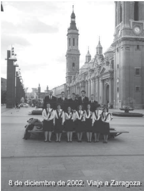
8 de diciembre de 2002. Viaje a Zaragoza.

En 2002, el grupo se vio reducido, consolidándose como Coro de Cámara, manteniendo su estructura vocal a cuatro cuerdas y acompañamiento musical a cargo de Marco Antonio Molín Ruiz como miembro activo. Además de las funciones religiosas y conciertos habituales en Huelva capital y provincia, destacaron dos efemérides singulares en el último trimestre del año, por un lado la firma del convenio de colaboración con la Universidad de Huelva (con la que habíamos participado activamente durante un período) para potenciar la creación de un Coro Universitario, y por otro la participación en