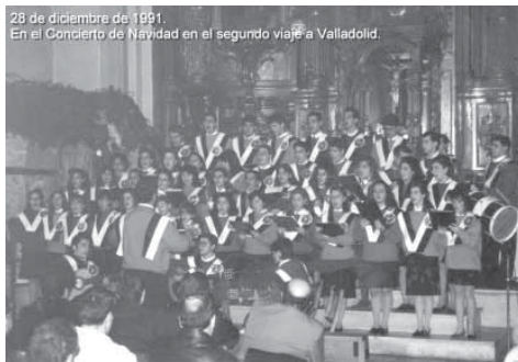
28 de diciembre de 1991. En el Concierto de Navidad en el segundo viaje a Valladolid.

En la misma línea de años anteriores, comenzamos 1991 participando en distintos actos Cuaresmales y siguiendo con el ritmo establecido de ensayos y actuaciones continuas, aunque fue el último mes del año el más novedoso en cuanto a experiencias vividas hasta el momento, ya que debido a los nuevos contactos adquiridos el año anterior en el I Encuentro de Hermandades de la Sagrada Cena de España en Valladolid,