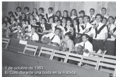
1 de octubre de 1983. El Coro durante una boda en la Rábida.