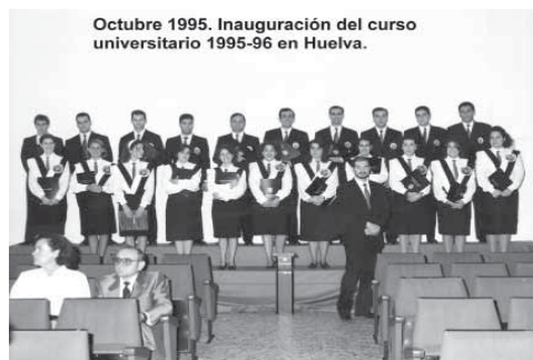
Octubre 1995. Inauguración del curso universitario 1995-96 en Huelva.

Otra novedad surgida este año, y que se mantuvo vigente hasta 1997, fue el hecho de que la Coral pasó a ser la encargada de poner música a la apertura oficial del curso académico de la Universidad de Huelva, y a diversos actos de la misma a lo largo del año, llegando a ser reconocida como el Coro de la Universidad.