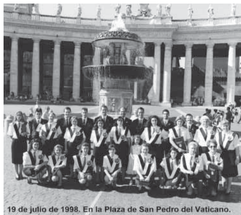
19 de julio de 1998. En la Plaza de San Pedro del Vaticano.

Volvimos a vivir un año especial, no solo porque se cumplió nuestro Vigésimo Aniversario, sino porque seguíamos recorriendo mundo. Como punto culminante de nuestro veinte cumpleaños, la Coral cantó la Misa Dominical del 19 de julio en la Basílica de San Pedro de Roma (Italia), invitados por la "Associazione Amicci de la Música Sacra" y en la Santa Trinita de Florencia (Italia) con lo que la Agrupación Coral celebró esta importante efemérides.