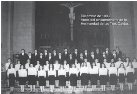
Diciembre de 1993 Actos del cincuentenario de la Hermandad de las Tres Caídas.

Un intenso estudio del Villancico culminó en 1993 con la primera grabación discográfica de la historia de la Coral, con la adaptación del más puro y tradicional estilo navideño andaluz, repertorio que ha hecho famosa a la Coral y a la Hermandad fuera de la provincia, e incluso del